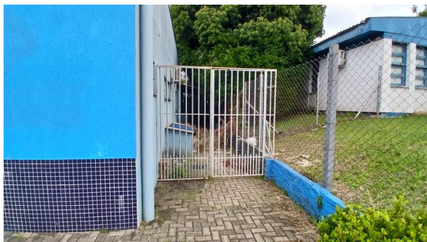
Figura 8: Portão lateral, acesso à farmácia

A pintura de superfícies metálicas será executada com tinta esmalte semibrilho em duas demãos, mediante preparo prévio: limpeza com solventes ou desengordurantes, lixamento, aplicação de 01 demão de fundo anticorrosivo. Garantir que não tenha nenhum ponto de corrosão na superfície para início do serviço. O material para pintura deve ser de boa qualidade, garantindo superfície homogênea. Deve ser utilizada marca consolidado no mercado, de fabricantes idôneos.