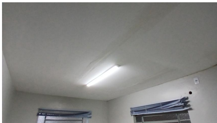
Figura 1: Sala Saúde 1 (ex Farmácia)