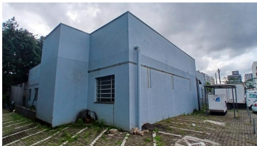
Figura 5: Fachada sudeste.