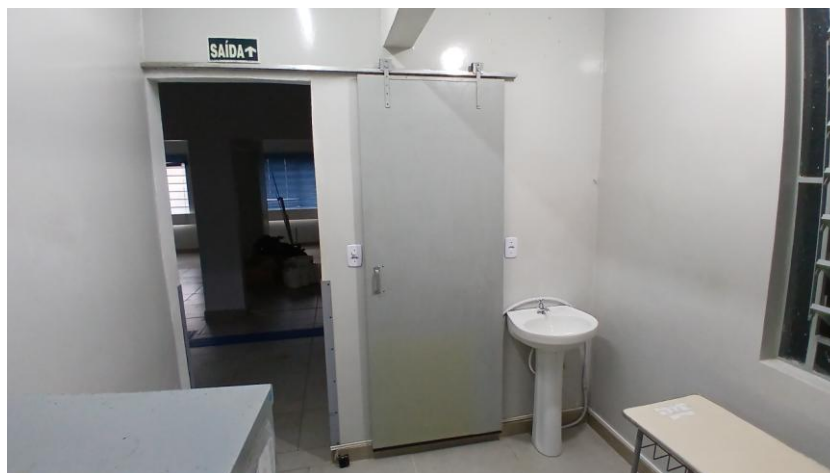
Figura 7: Porta de madeira a repintar (Recepção, ex Sala de Vacinas)