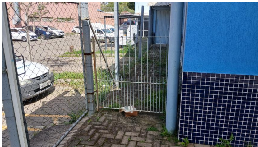
Figura 9: Portão lateral, acesso ao "Melhor em Casa 2" (ex "Sala de Apoio")