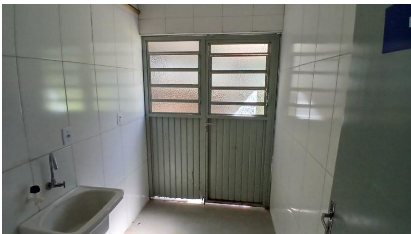
Figura 10: Porta da lavanderia