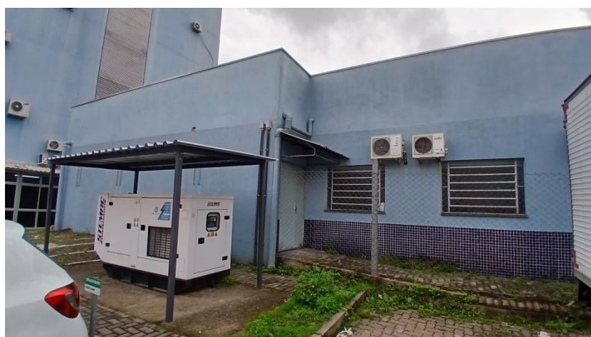
Figura 4: Fachada leste