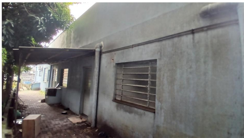
Figura 6: Fachada sul