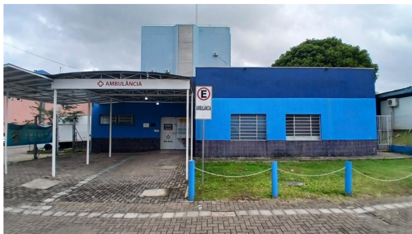
Figura 3: Fachada frontal