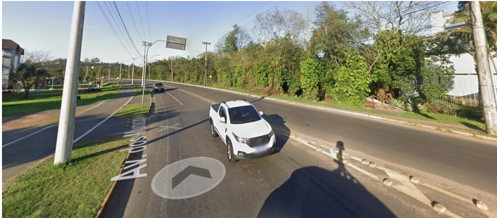
Início do trecho (Av Presidente Vargas)