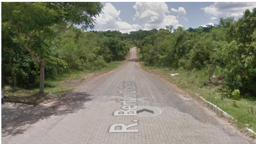
IMAGEM RUA BERTILO CANISIO SCHEIN (SENTIDO L-O)