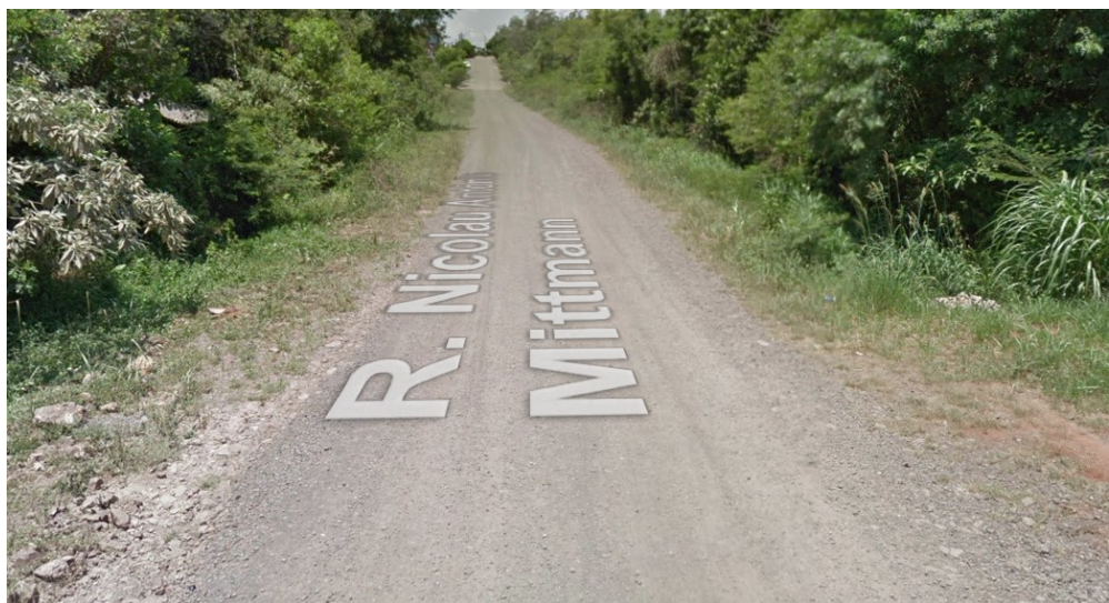
RUA NICOLAU ANTONIO MITMANN (SENTIDO L-O)