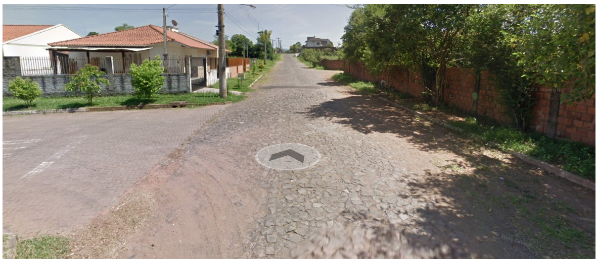
RUA MONTEIRO LOBATO SENTIDO (S-N)