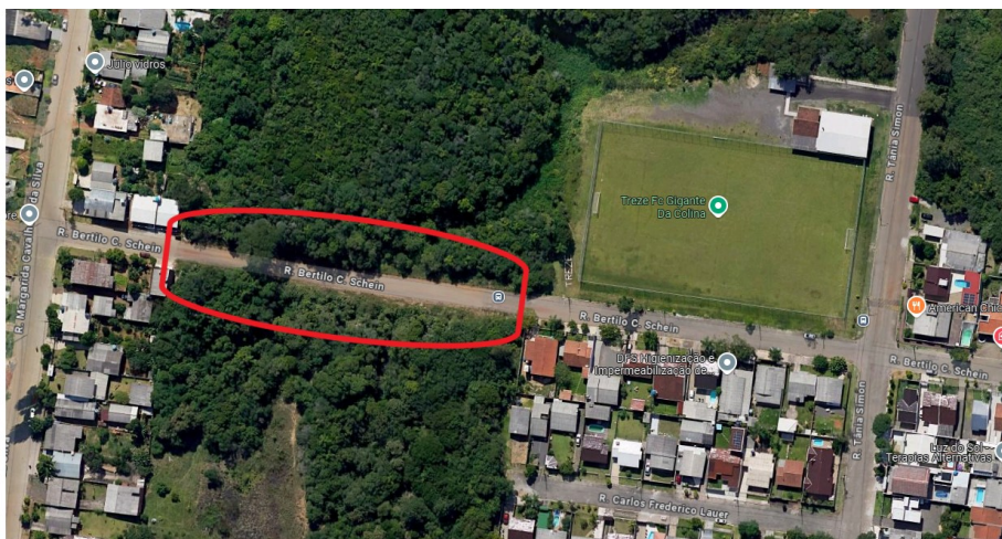
RUA BERTILO CANISIO SCHEIN (LOCALIZAÇÃO)