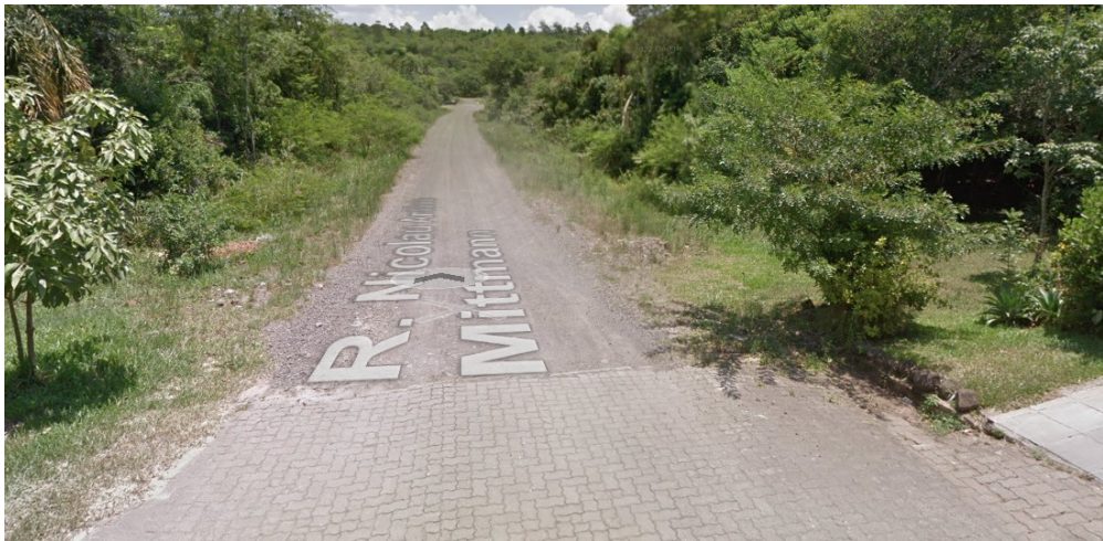
RUA NICOLAU ANTONIO MITMANN (SENTIDO L-O)