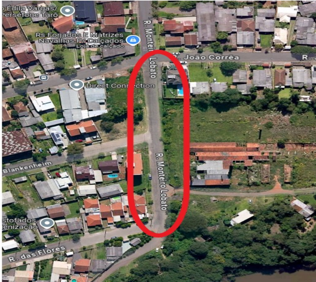
RUA MONTEIRO LOBATO (LOCALIZAÇÃO)