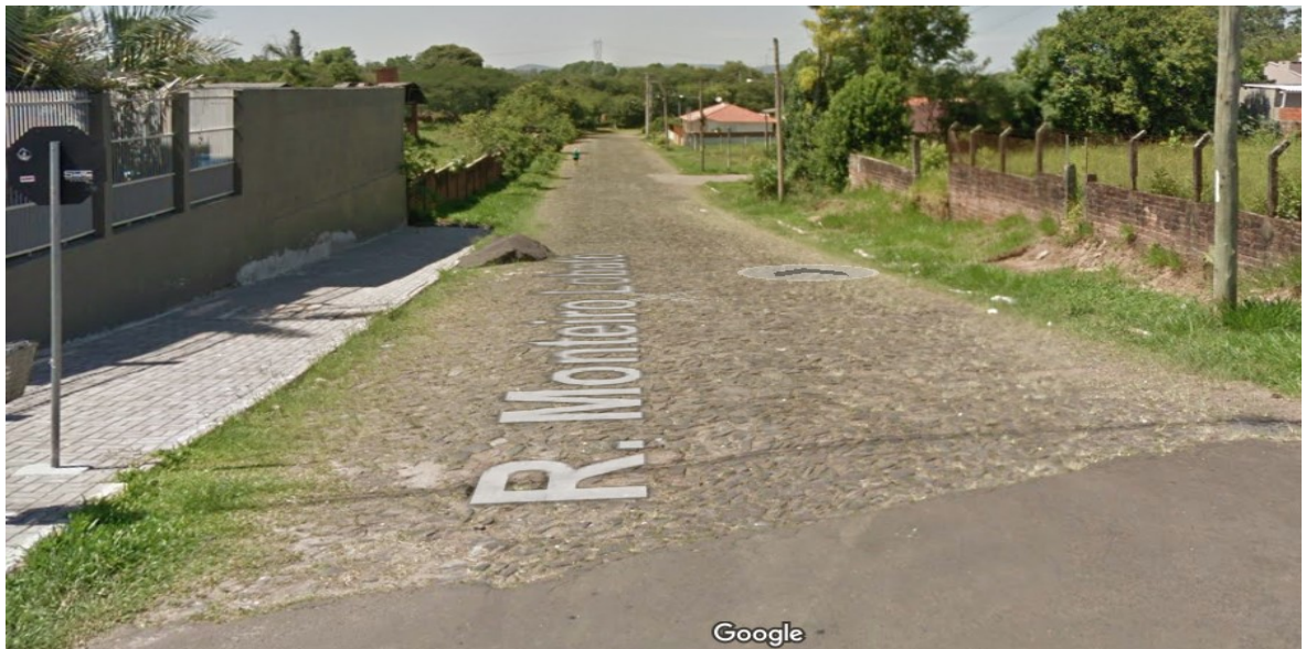
RUA MONTEIRO LOBATO SENTIDO (N-S)