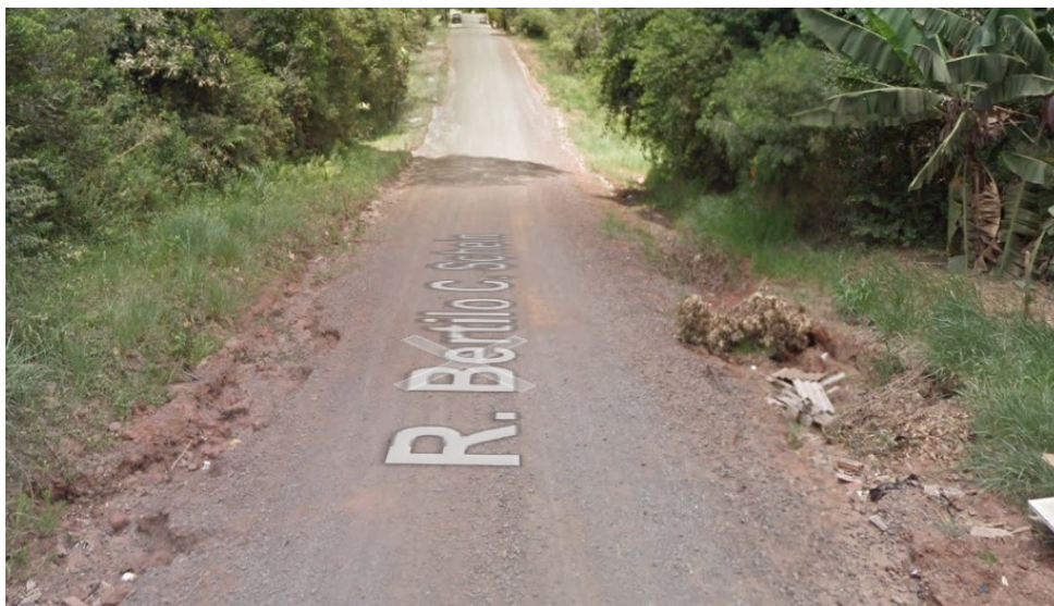
IMAGEM RUA BERTILO CANISIO SCHEIN (SENTIDO O-L)