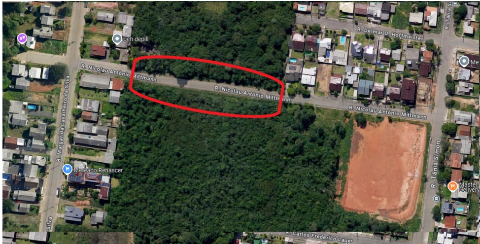
RUA NICOLAU ANTONIO MITMANN (LOCALIZAÇÃO)