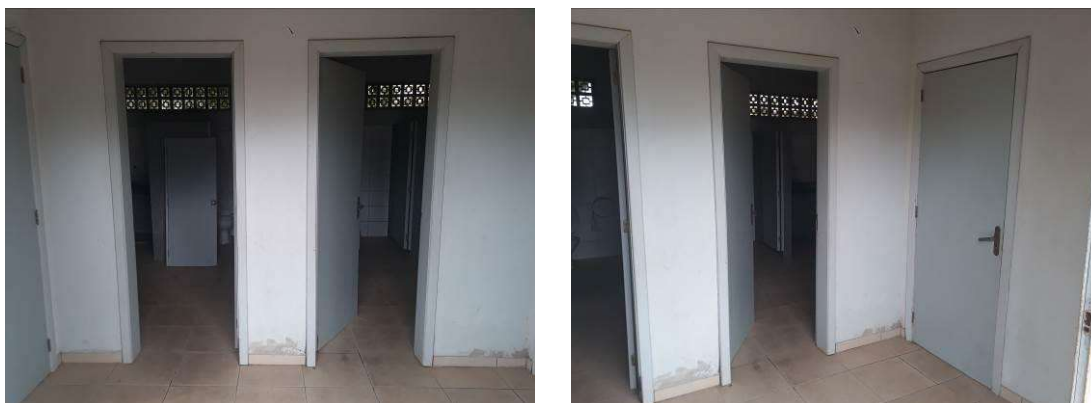
Figura 40: Portas empenadas.

Deve ser realizado troca de 3 das portas internas, que se encontram empenadas, e a porta de um dos sanitários deve ser reinstalada. Todas as portas internas devem ter suas ferragens tratadas contra ferrugem.