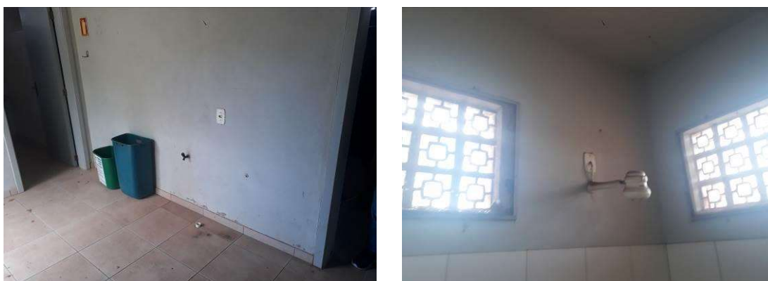
Figura 15: Amostragem de áreas a pintar.

Será realizada pintura das paredes internas, sobre as áreas rebocadas, tetos e alvenaria exposta. A pintura será realizada em toda a altura do hall e acima da altura das cerâmicas.