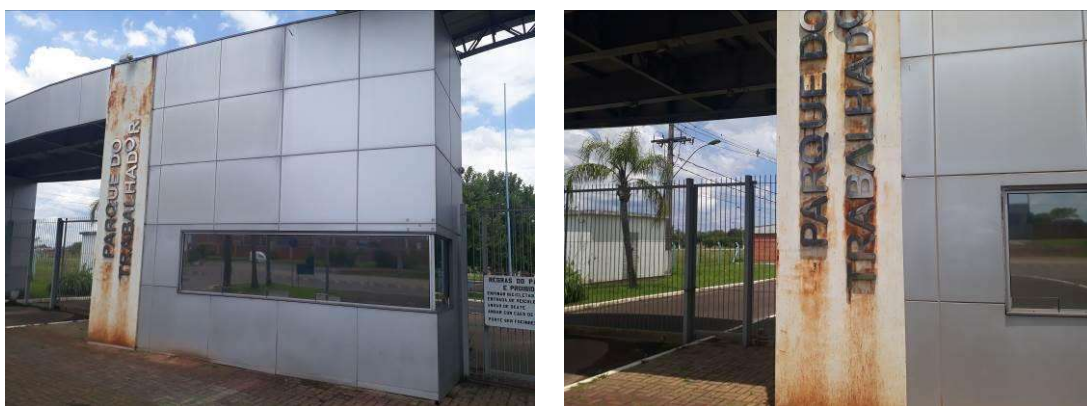
Figura 1: Frente da guarita

Será realizada limpeza sobre a superfície com lava jato. Em razão da alta pressão, é esperado dano nas juntas. Em função dos danos causados pela limpeza será removido o PU das juntas e será aplicado PU novo. O letreiro será removido, e reinstalado após o tratamento da ferrugem e subsequente pintura do painel.