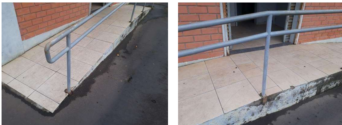
Figura 38: Reparos a executar na rampa.

Há reparos pontuais a serem realizados no piso da rampa de acesso.