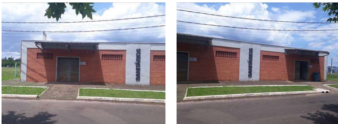
Figura 10: Vista frontal dos banheiros.

Será realizada pintura das paredes externas, sobre as áreas rebocadas e sobre a alvenaria exposta.