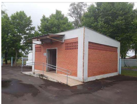
Figura 36: Paredes externas do banheiro