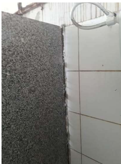
Figura 30: Divisória com fenda na junta com a parede.

As movimentações de solo citadas em 4.8 ocasionaram abertura de fendas entre as divisórias dos banheiros e as paredes que devem ser seladas com PU.