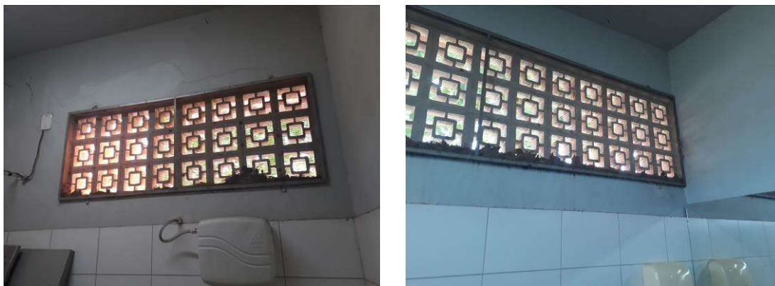
Figura 25: Telas mosquiteiro a remover.

Serão removidas todas as telas mosquiteiro internas, que serão reinstaladas externamente, a fim de evitar acúmulo de sujeira.