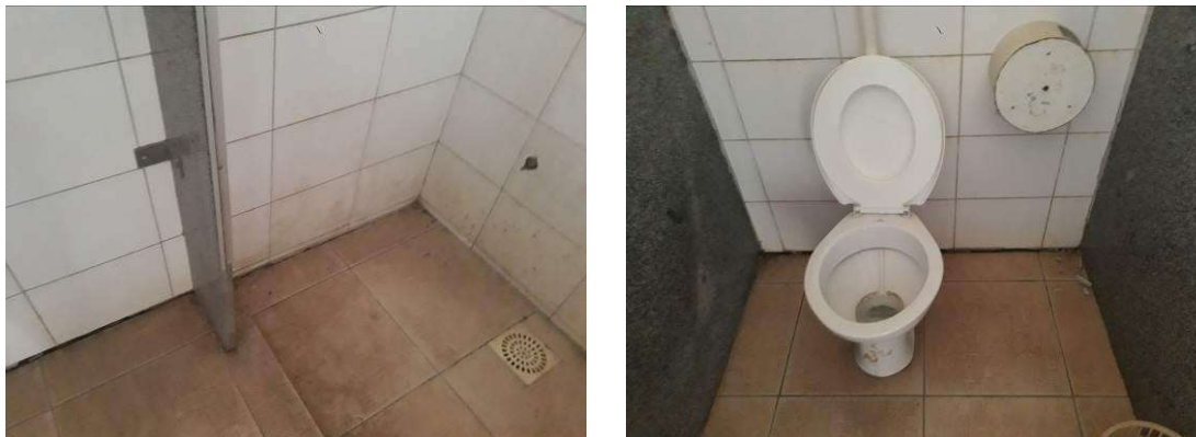
Figura 29: Fendas nos rodapés.

Movimentações do solo ocasionaram a abertura de fendas ao longo da parede norte, que serão fechadas com poliuretano.