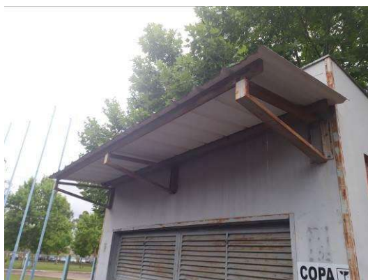
Figura 47: Estruturas metálicas dos beirais.

As estruturas metálicas dos beirais serão lixadas, tratadas contra ferrugem, aplicadas fundo e pintadas.