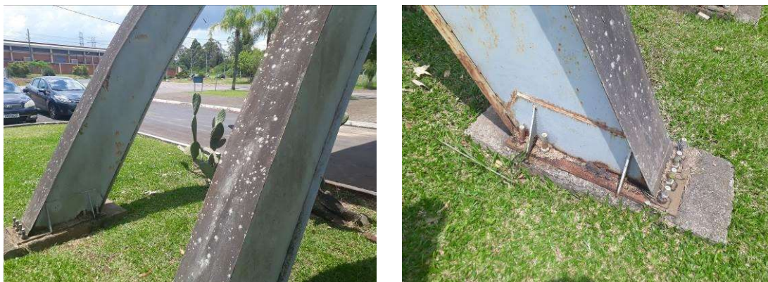
Figura 5: Áreas com pintura danificada; pontos de ferrugem nas bases.

A estrutura da ala sudeste do pórtico apresenta danos extensos à sua pintura, sendo necessária lixagem, tratamento de ferrugem em pontos críticos, aplicação de fundo e repintura