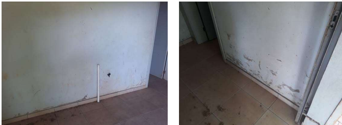
Figura 24: Amostra de paredes a pintar.

Será realizada pintura das paredes internas, sobre as áreas rebocadas, tetos e alvenaria exposta. A pintura será realizada em toda a altura do hall e acima da altura das cerâmicas.