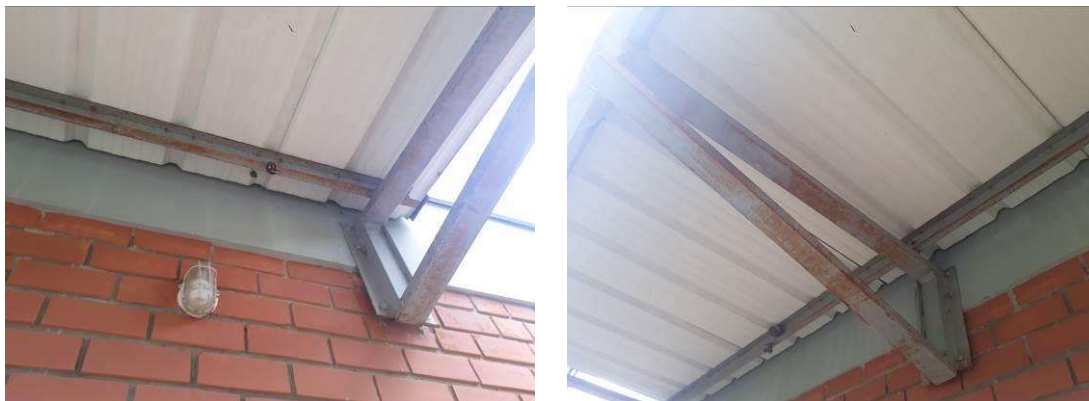
Figura 12: Estruturas metálicas dos beirais.

As estruturas metálicas dos beirais serão lixadas, tratadas contra ferrugem, aplicadas fundo e pintadas.