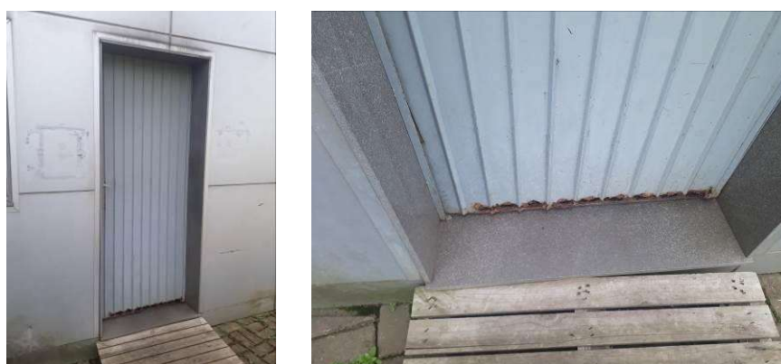
Figura 4: Porta metálica com danos causados pela ferrugem.