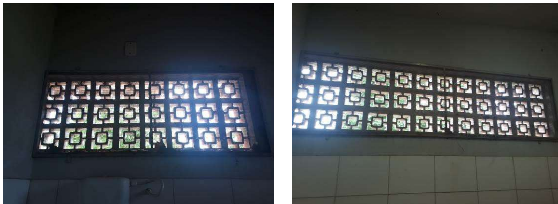
Figura 16: Telas mosquiteiro a remover.

Serão removidas todas as telas mosquiteiro internas, que serão reinstaladas externamente, a fim de evitar acúmulo de sujeira.