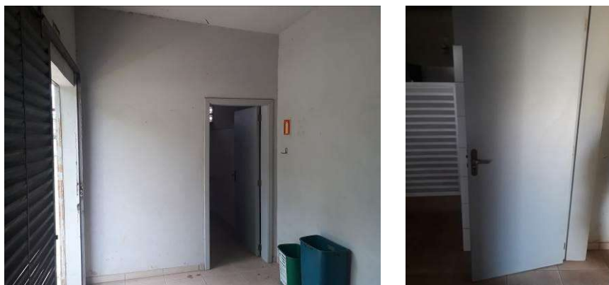
Figura 17: Porta de acesso ao sanitário PNE e porta a ser trocada.

As portas vaivém estão com ferrugem nas dobradiças, sendo necessário tratamento. Todas as portas internas devem ter suas ferragens tratadas contra ferrugem.