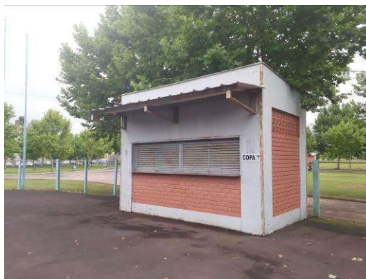
Figura 45: Paredes externas da copa

Será realizada pintura das paredes externas, sobre as áreas rebocadas e sobre a alvenaria exposta.