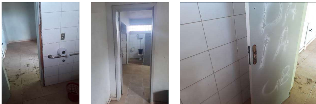
Figura 26: Portas de acesso aos sanitários e porta de acesso ao sanitário PCR/PMR.