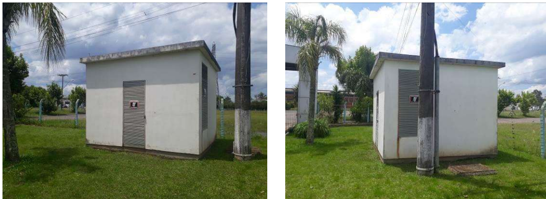
Figura 8: Vistas externas da subestação.

As paredes externas da subestação devem ser pintadas, e as esquadrias devem ser devidamente tratadas contra ferrugem onde necessário.