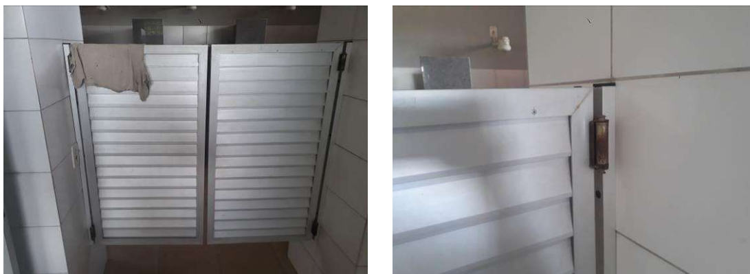
Figura 18: Portas vaivém com ferrugem nas dobradiças.