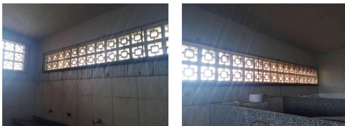
Figura 28: Sujeira próximo às aberturas.

As aberturas aos fundos dos sanitários do banheiro masculino estão sujas com ferrugem, devendo ser limpas antes da pintura.