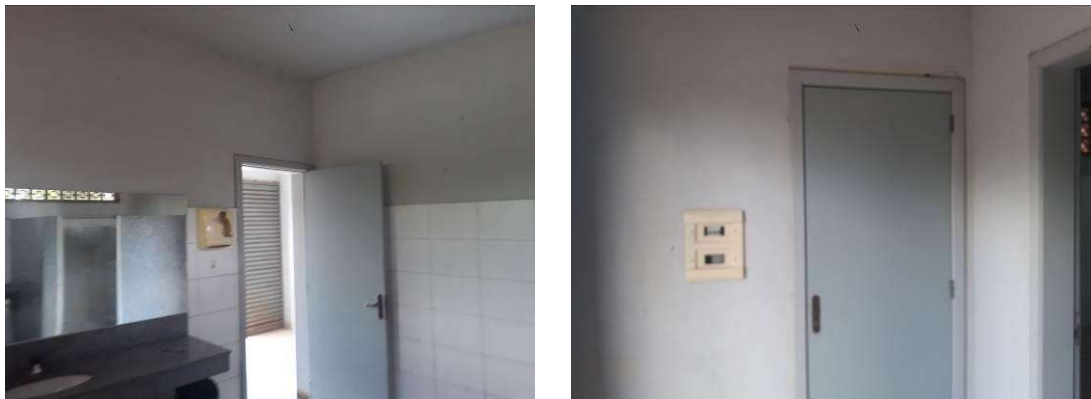
Figura 39: Amostra de paredes a pintar.

Será realizada pintura das paredes internas, sobre as áreas rebocadas, tetos e alvenaria exposta. A pintura será realizada em toda a altura do hall e acima da altura das cerâmicas.