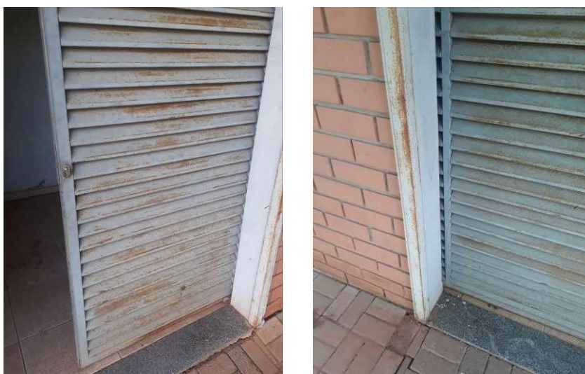
Figura 23: Portas de acesso à edificação.

Ambas as portas de entrada devem ser lixadas, tratadas e repintadas.