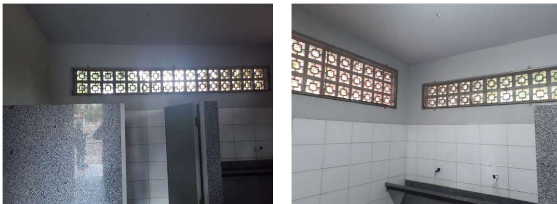
Figura 42: Telas mosquiteiro a remover.

Serão removidas todas as telas mosquiteiro internas, que serão reinstaladas externamente, a fim de evitar acúmulo de sujeira.