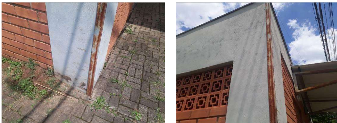
Figura 13: Perfis metálicos acabamentos.

Ambas as portas de entrada devem ser lixadas, tratadas e repintadas.