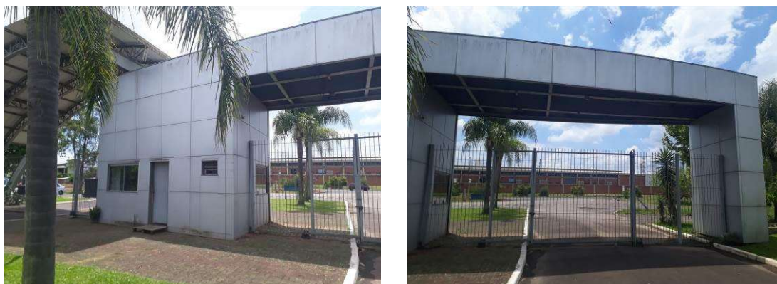
Figura 2: Fachada dos fundos.

A porta de acesso à guarita está com danos avançados, necessitando ser trocada. A janela apresenta danos causados por ferrugem, sendo necessária lixagem, tratamento contra ferrugem e repintura