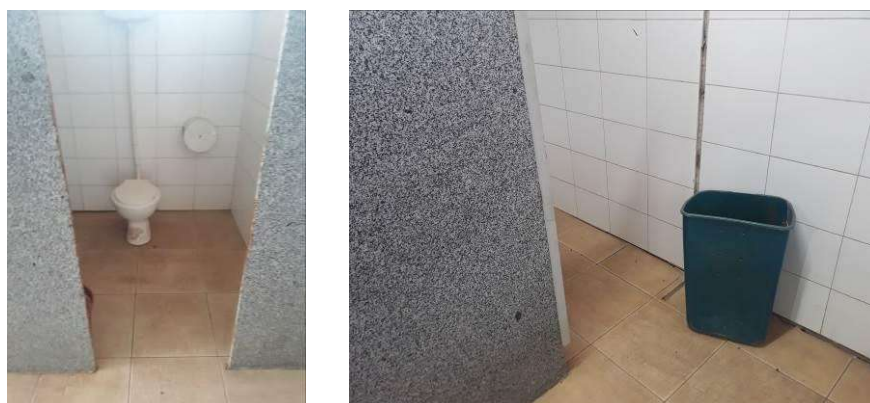
Figura 27: Porta metálica dos banheiros masculino e feminino.