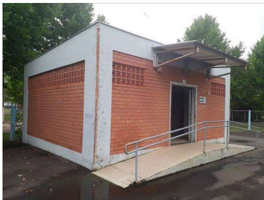
Figura 34: Paredes externas do banheiro

Será realizada pintura das paredes externas, sobre as áreas rebocadas e sobre a alvenaria exposta.