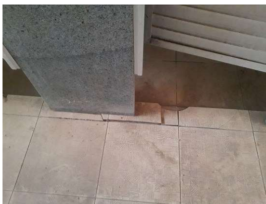
Figura 32: Piso quebrado no banheiro masculino.