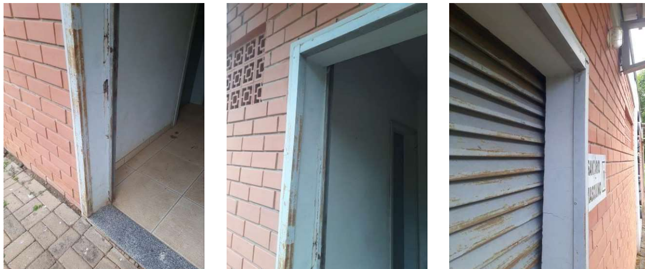
Figura 11: Reparos em argamassa

São necessários reparos em argamassa próximos à porta do banheiro masculino: