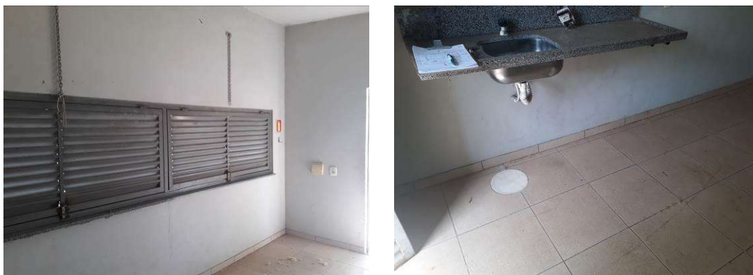
Figura 46: Paredes internas da copa