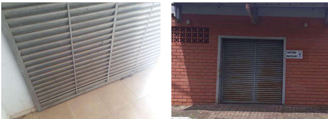
Figura 14: Portas de acesso à edificação.

Ambas as portas de entrada devem ser lixadas, tratadas e repintadas.