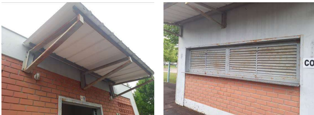
Figura 44: Estruturas metálicas dos beirais.

Da mesma forma, os acabamentos metálicos, rufos e esquadrias também deverão ser lixados, tratados e pintados.