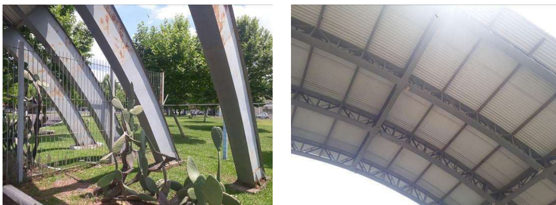
Figura 6: Estrutura do pórtico; Áreas menos danificadas localizadas abaixo do telhado.

A estrutura da ala noroeste do pórtico apresenta boas condições de conservação, sendo necessária apenas limpeza e repintura.