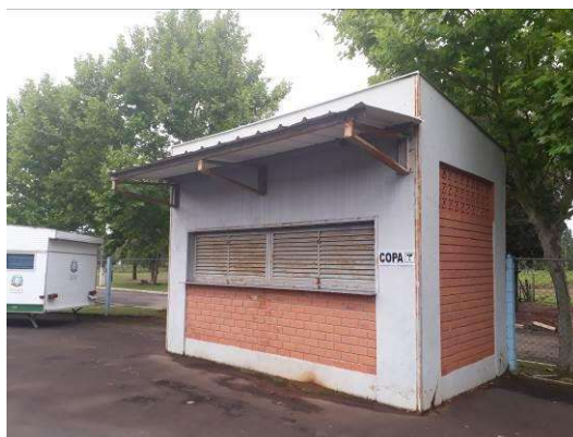
Figura 43: Paredes externas da copa

Será realizada pintura das paredes externas, sobre as áreas rebocadas e sobre a alvenaria exposta.