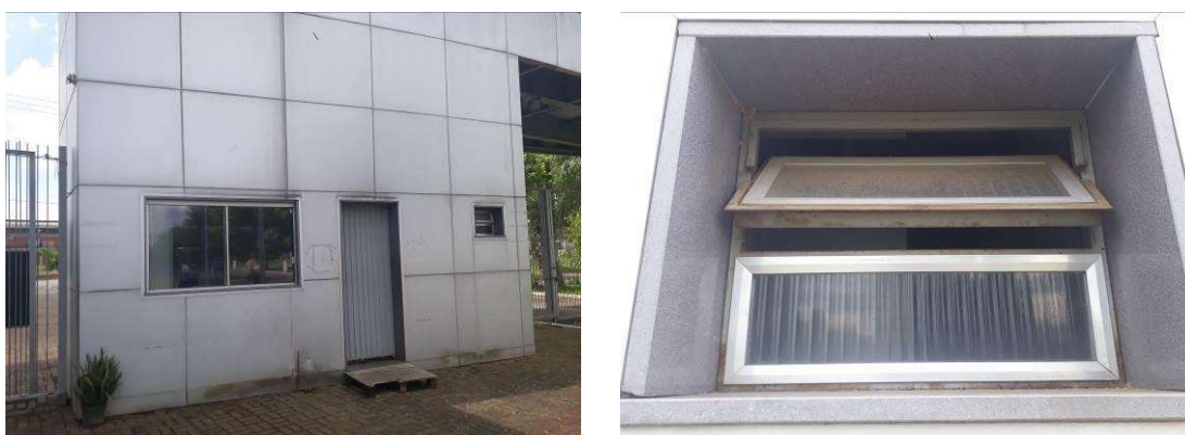
Figura 3: Vista geral da guarita; danos causados à janela.

A porta de acesso à guarita está com danos avançados, necessitando ser trocada. A janela apresenta danos causados por ferrugem, sendo necessária lixagem, tratamento contra ferrugem e repintura