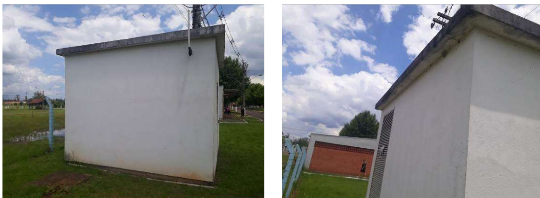
Figura 9: Vistas externas da subestação.