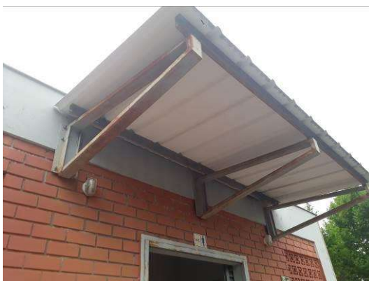
Figura 37: Estruturas metálicas dos beirais.

As estruturas metálicas dos beirais serão lixadas, tratadas contra ferrugem, aplicadas fundo e pintadas.