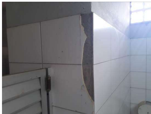
Figura 31: Cerâmicas quebradas na parede do banheiro feminino.