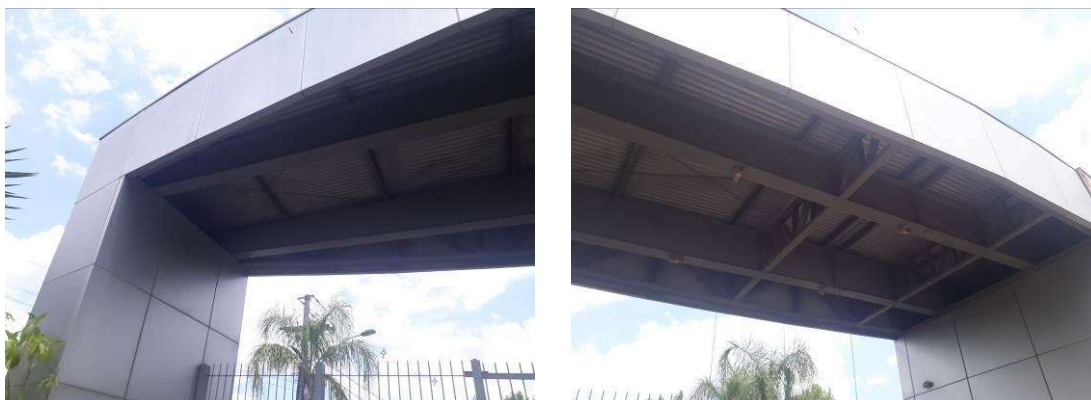
Figura 7: Estrutura da ala noroeste do pórtico.

A estrutura da ala noroeste do pórtico apresenta boas condições de conservação, sendo necessária apenas limpeza e repintura.