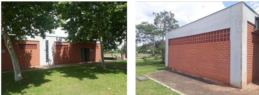
Figura 19: Vista frontal e lateral do banheiro.

Será realizada pintura das paredes externas, sobre as áreas rebocadas e sobre a alvenaria exposta.