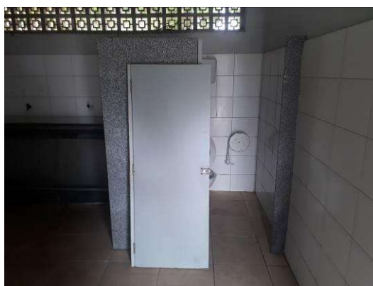
Figura 41: Porta do banheiro a ser reinstalada.